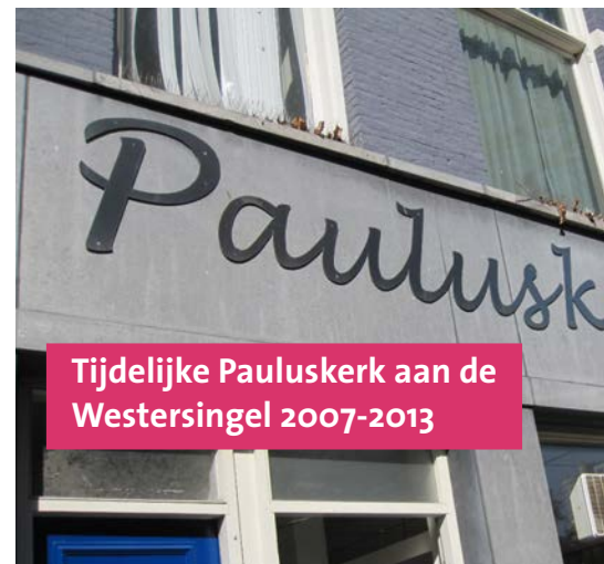
Tijdelijke Pauluskerk aan de Westersingel 2007-2013