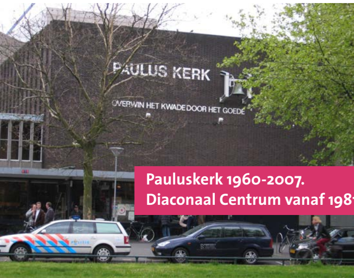
Pauluskerk 1960-2007. Diaconaal Centrum vanaf 1981