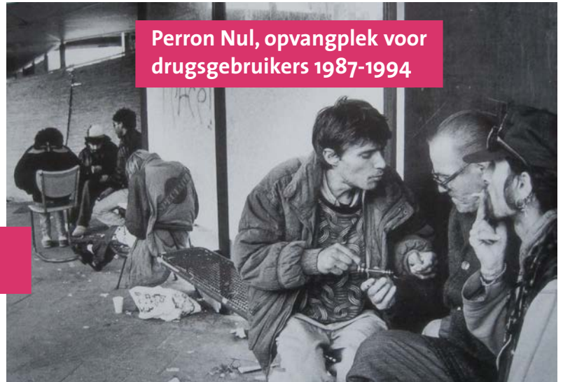
Perron Nul, opvangplek voor drugsgebruikers 1987-1994